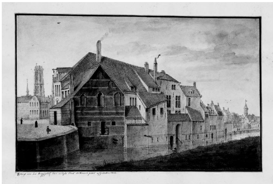
Zicht op de 'Kranken' of Infirmerie van het Groot Begijnhof. Pentekening en aquarel toegeschreven aan Arnold Frans Van den Eynde (19de eeuw)

In de 15de eeuw stond op deze plaats een gebouwencomplex dat als refugiehuis van de Sint-Bernardsabdij van Hemiksem diende. Eind 16de eeuw namen de begijnen het in gebruik als infirmerie ('Kranken') voor zieke, armlastige begijnen. In de 19de eeuw werd het ingericht als godshuis voor oude vrouwen en later in diezelfde eeuw als stoomzagerij. Sedert het einde van de 19de eeuw maken de overblijvende gebouwen deel uit van de brouwerij.