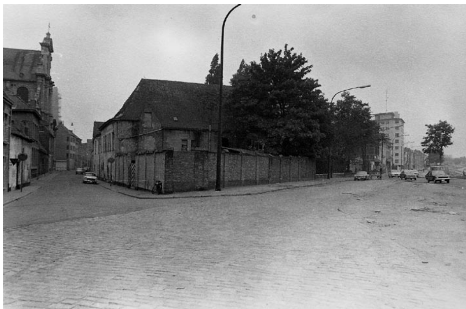
Vermoedelijk jaren '70.